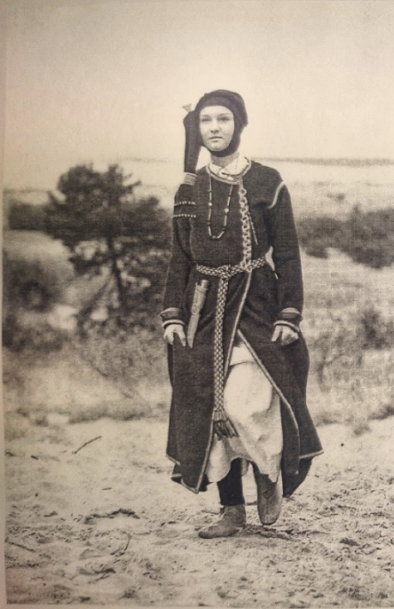
Modelis Nr. 1