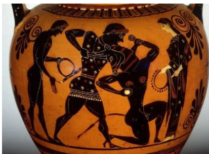
Dē Thēsēō et Mīnōtaurō